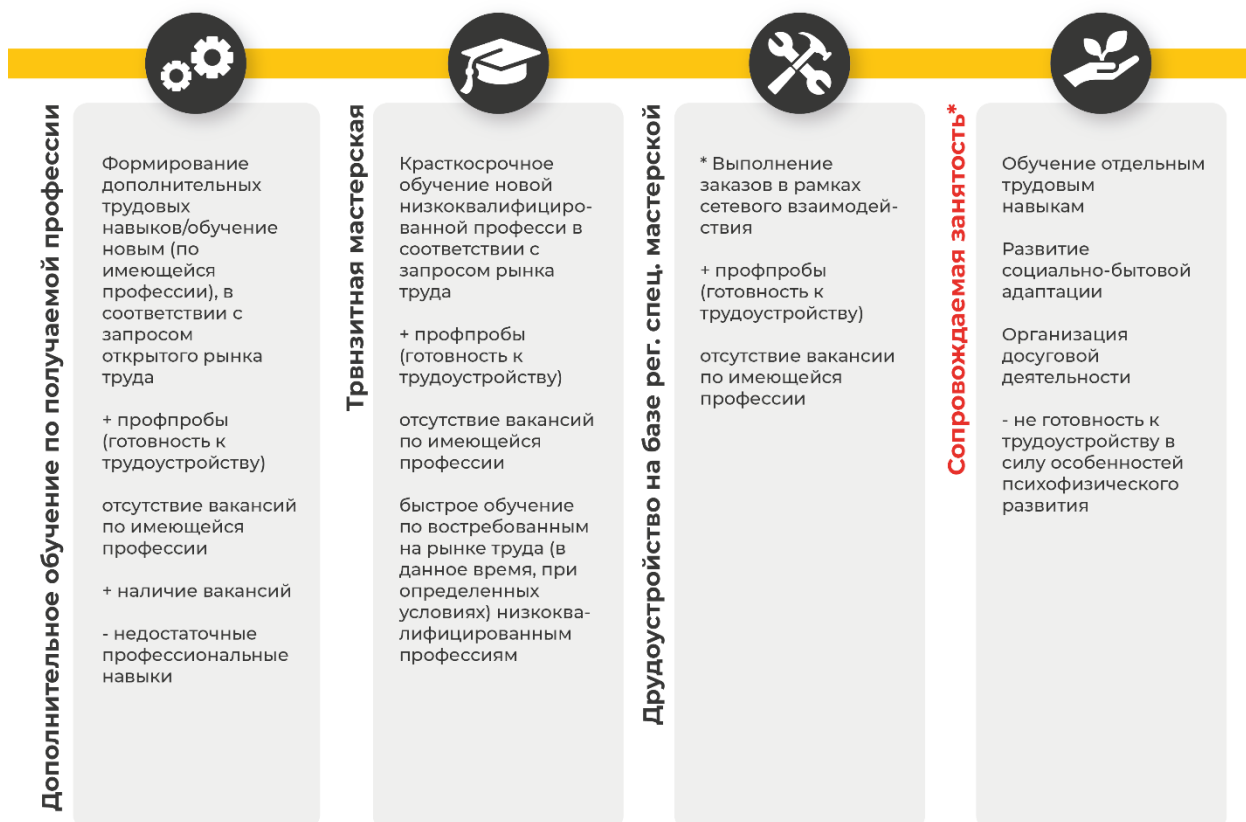
Рисунок 4. Возможные траектории работы с обучающимися с интеллектуальными нарушениями

*Данный вид деятельности региональной специализированной мастерской рекомендован для лиц с интеллектуальными нарушениями, в том числе для лиц с тяжелыми и глубокими формами интеллектуальных нарушений.