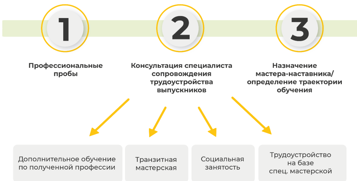
Рисунок 3. Примерный алгоритм деятельности региональной специализированной мастерской