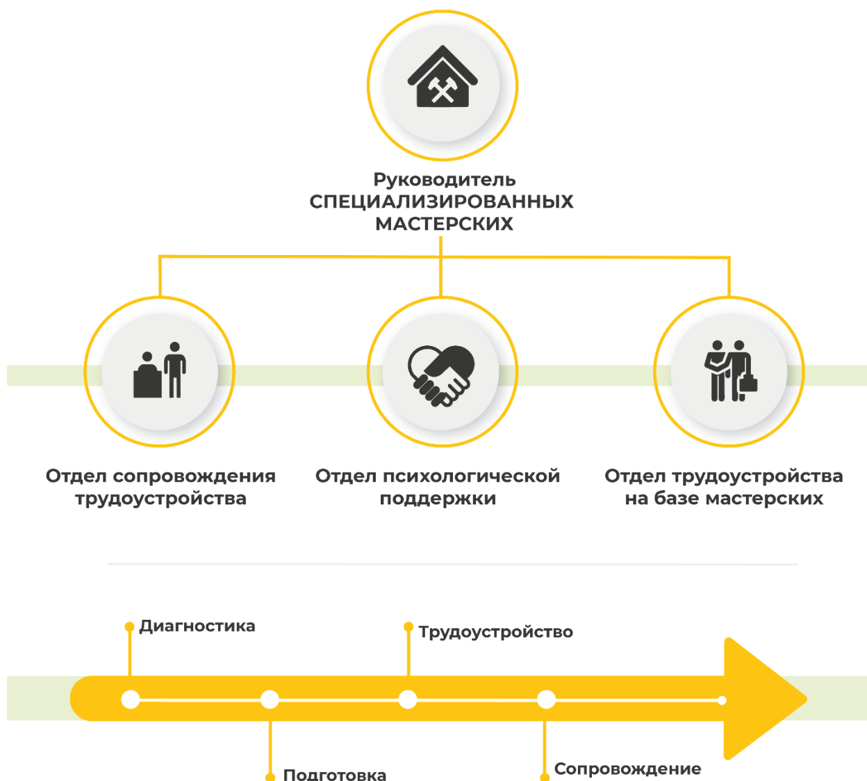
Рисунок 2. Примерная рекомендуемая структура региональных специализированных мастерских