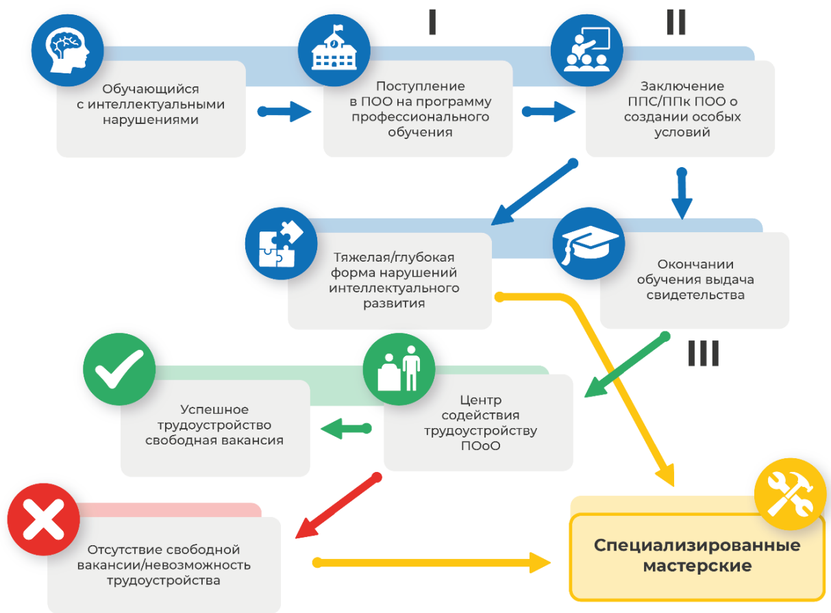
Рисунок 5. Примерная рекомендуемая стратегия организации образовательного маршрута, обучающегося с интеллектуальными нарушениями.

I. Обучающийся с интеллектуальными нарушениями, при поступлении в профессиональную образовательную организацию на обучение по программам профессионального обучения предоставляет документы, подтверждающие статус инвалида и лица с ограниченными возможностями здоровья.